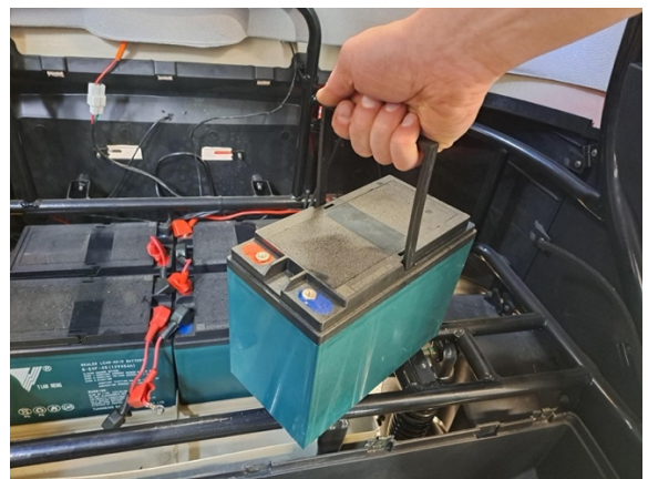
Nosta akku pois.

Uuden osan asennus käänteisessä järjestyksessä.